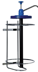
Pompe + support « basket » pot 4,4 L 11027