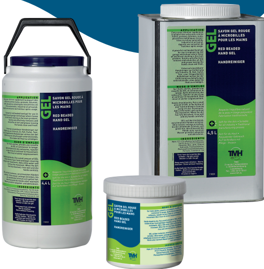
Pot 600 mL 11035 • Pot 4,4 L 11012 Bidon métal 4,5 L 11023