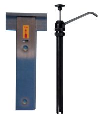
Support mural + pompe bidon métal 4,5 L 11040